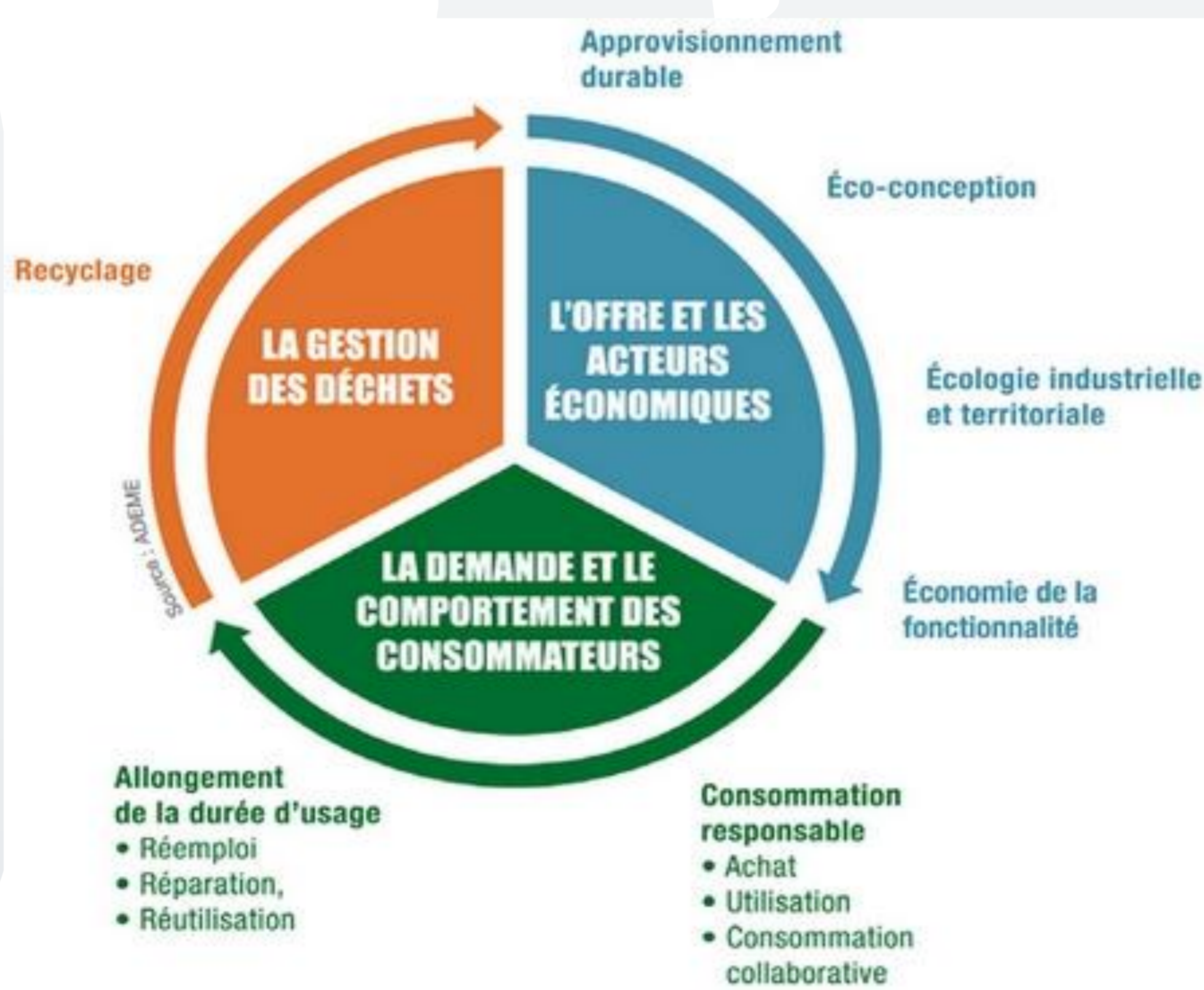
Schéma extrait du site centre.ademe.fr

Ce mémoire a pour objectif de rendre compte et d'évaluer les bénéfices économiques, sociaux et environnementaux que l'Économie circulaire génère sur le territoire normand.