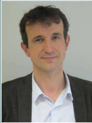
V. LE GRAND UCBN